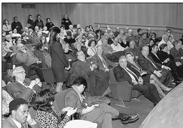
Més de 150 persones escoltaren la conferència.