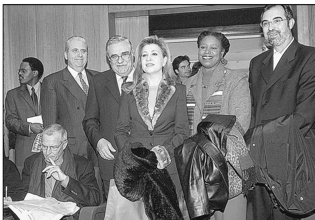
McKinney rebé el suport de nombroses autoritats.