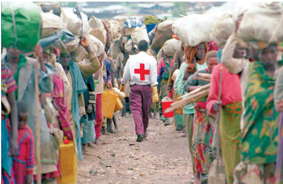
Les massacres humanitàries de Rwanda i del Congo són les més terribles des de la Segona Guerra Mundial.