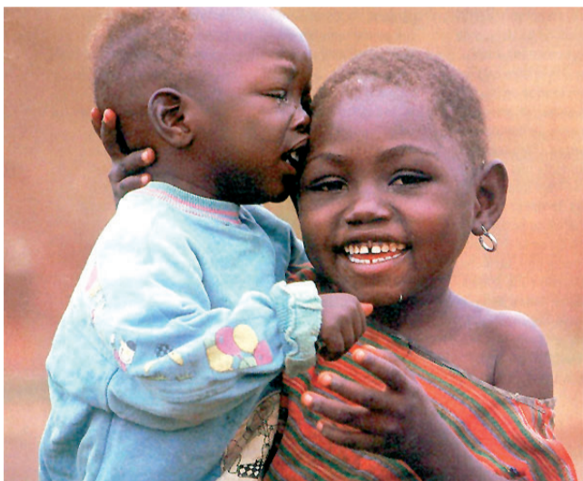
El somriure a l'Àfrica dels Grans Llacs encara és possible.

nunciat davant de les autoritats civils i eclesiaístiques la situació tràgica dels refugiats, en l'atenció dels quals abocava gran part dels seus esforços solidaris. El 26 d'abril del 1994 va ser segrestat, torturat i assassinat, després que el dia abans hagués estat amenaçat de mort. Mai no van trobar-ne el cos.