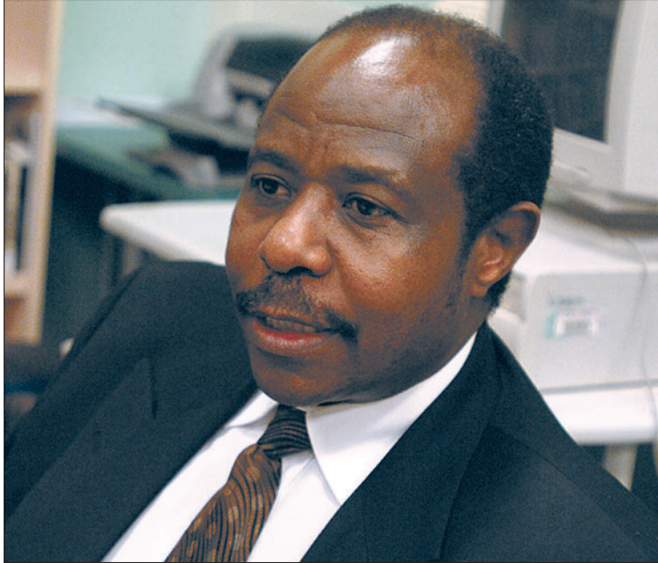
Paul Rusesabagina, ahir, al Centre Flors Sirera durant l'entrevista