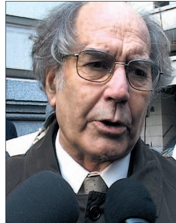
Adolfo Pérez Esquivel

«Democràcia i drets humans són valors indivisibles»