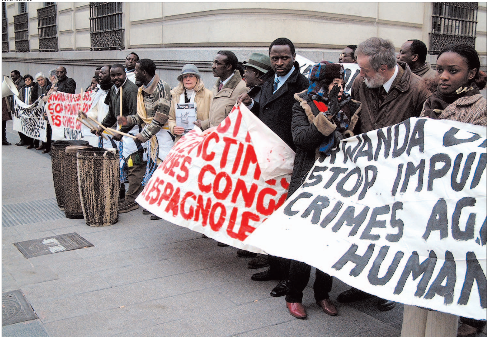
Rwandesos exiliats clamaven justícia ahir a la porta de l'Audiència Nacional per acompanyar la denúncia per crims de guerra