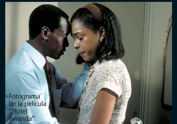
Fotograma de la película "Hotel Rwanda"